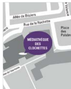
A l'espace Léon Blum